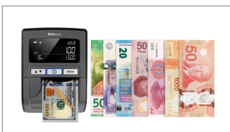
Pode inserir notas em qualquer posição