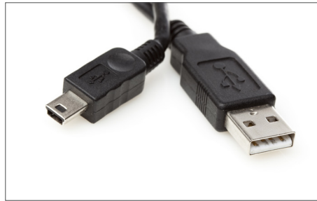
Safescan Cabo USB atualização Art. no: 112-0459