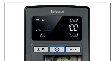
Mostra quantidades e totais