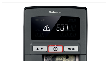
Alarme de nota suspeita, com alerta visual e acústico