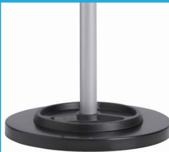
Socle lesté 6 kg + égouttoir