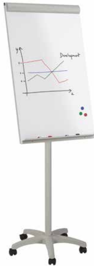
Tableau mobile métallique, magnétique pour écriture au marqueur effaçable à sec. Peut recevoir bloc de papier universel. Non réglable en hauteur. N'admet pas de bras télescopiques. Facile à monter.