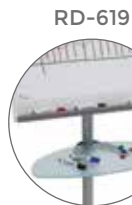
Bandeja porta útiles de cristal Optional glass tray