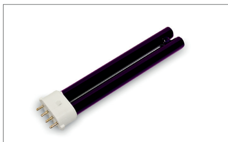
Safescan 50 / 70 Lâmpada UV