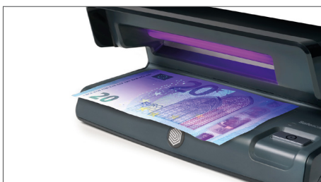
Detetor de dinheiro falso UV com um design que permite poupar espaço