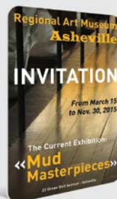
CRACHÁS PARA EVENTOS