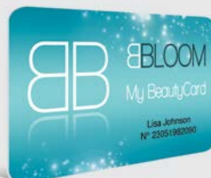
CARTÕES DE FIDELIDADE