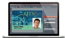
SOFTWARE DE CRIAÇÃO DE CARTÕES EVOLIS BADGE STUDIO®