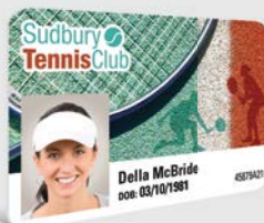
CARTÕES DE ASSOCIAÇÃO