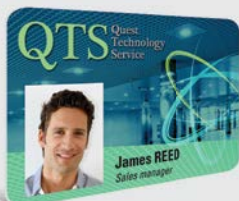
CRACHÁS DE FUNCIONÁRIOS