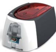
IMPRESSORA DE CARTÕES BADGY